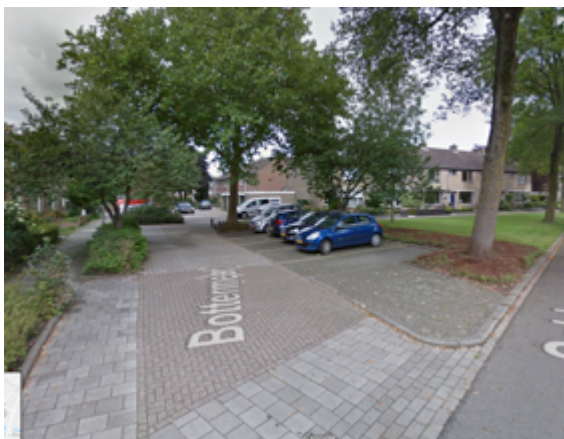
Beeld 2 Eerste deel van de straat