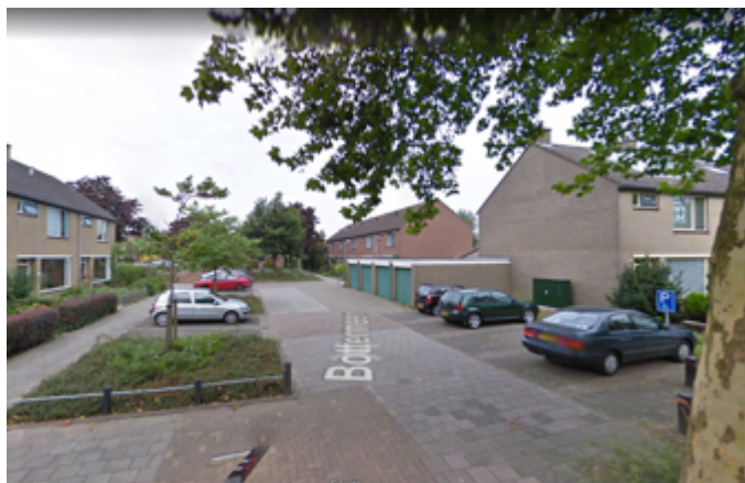
Beeld 3 Tweede deel van de straat