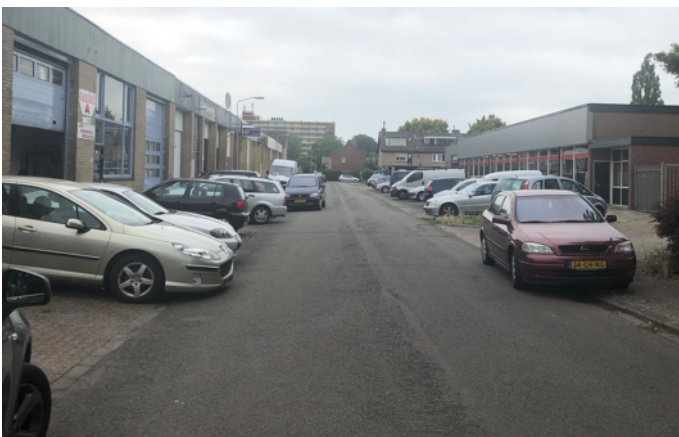
Beeld 2 Het parkeren